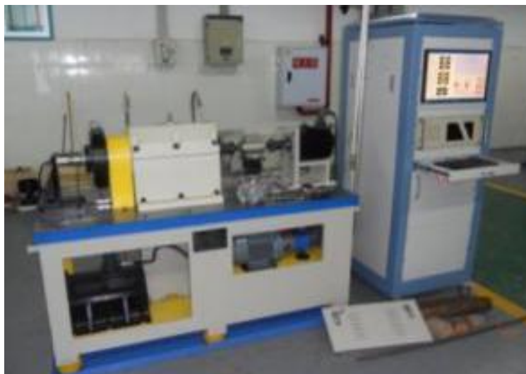
Macchina per controllo valore di coppia cuscinetti ruota