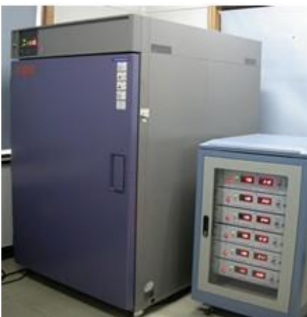
Test vita ad alte temperature per cuscinetti ruota

I nostri laboratori sono, inoltre, dotati di apparecchiature di misura e controllo che permettono di eseguire i test più avanzati sulla qualità e durata del prodotto: test dimensionali, test ad alta temperatura, test vita, nonché controlli metallurgici.