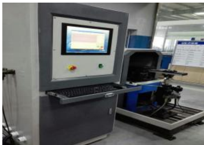
Macchina per test vibrazioni cuscinetti ruota