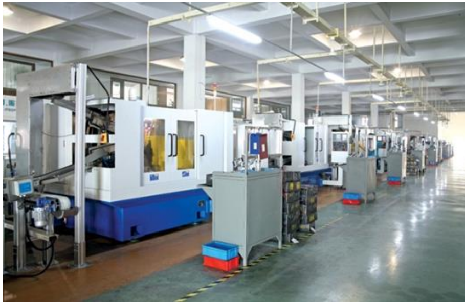
Linee automatiche di rettifica