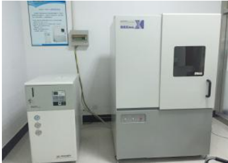
Diffratometro a raggi X

In modo particolare, i mozzi ruota richiedono un controllo attento alle condizioni di tempra ad induzione, che possa garantire la durezza sulle piste di rotolamento senza infragilire il materiale circostante.