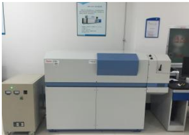
Spettrometro a lettura diretta